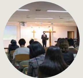
고3·수험생을 위한 기도회 10월 8일~11월 16일까지 웨슬리관 고등부실에서 기도회가 진행되고 있다.