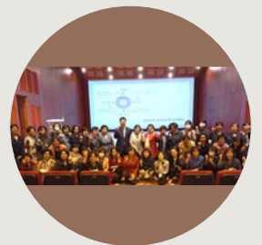
유앙겔리온 전도학교 종강 4주간 진행된 유앙겔리온 전도학교가 10월 9일 종강했다.